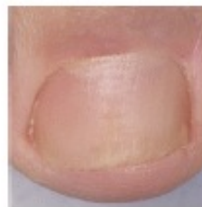
Después del tratamiento